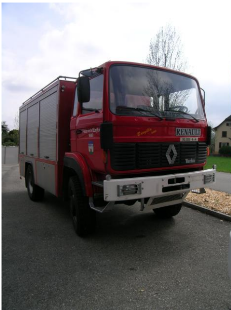
Camion remis au centre régional de Telciu

C'est dans le cadre de la fête anniversaire des 25 ans de la coopération Monthey/Telciu que s'est déroulée, en juin 2015, l'inauguration du centre régional de Telciu (BN), avec la remise d'un camion tonne-pompe, d'un véhicule de transport équipé et d'une échelle-remorquable. De l'équipement est également remis (équipements personnels, moto-pompe, chariot-échelle, etc). Les autres communes partenaires du projet ont également reçu des équipements personnels pour les pompiers volontaires.