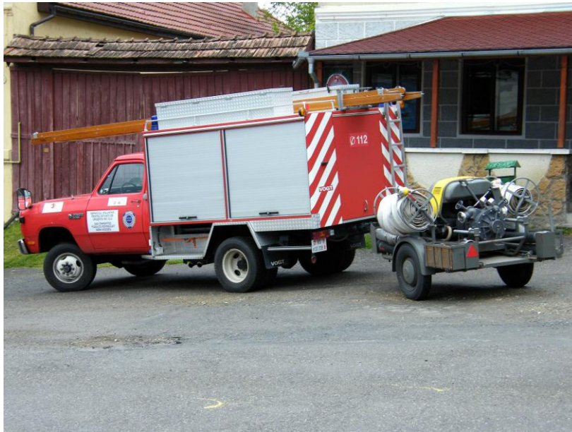
Remise des clés au maire de Sic/Szék,

Cette action, menée en collaboration avec le Rotary-Club de Gherla, s'est déroulée en présence de l'Inspecteur-chef de l'ISU du județ de Cluj, le colonel Moldovan. Une délégation de l'Association Nendaz-Gherla, ainsi que du partenaire belge de Sic/Szék, avaient fait le déplacement pour l'occasion.