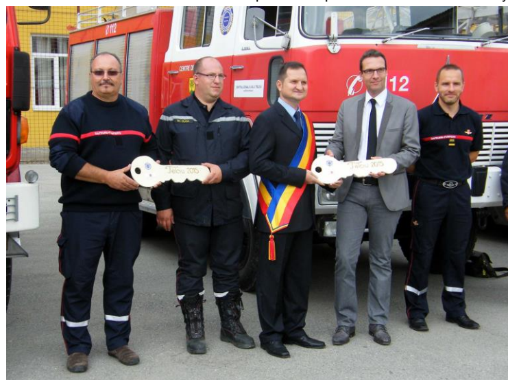
Véhicule de transport remis par les autorités de Monthey