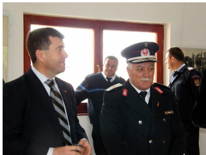
Le président du Conseil du județ de Harghita, et l'inspecteur-chef de l'ISU Harghita lors de la cérémonie