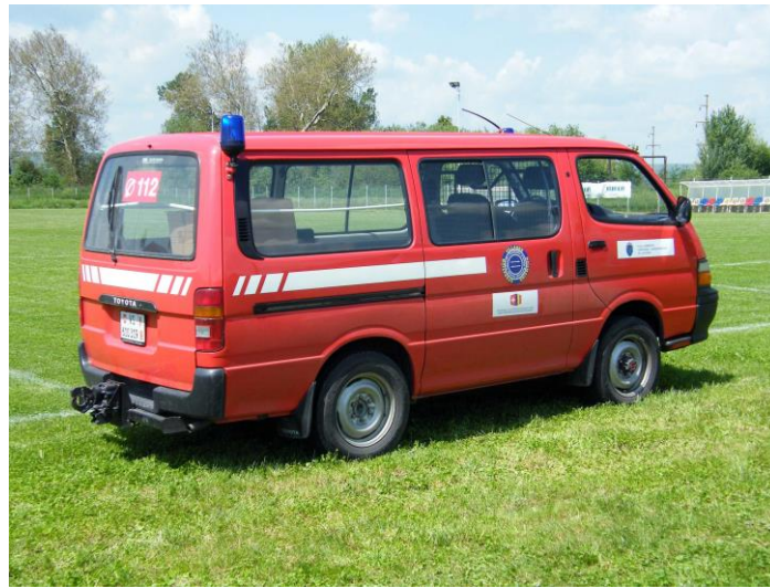
Véhicules remis aux pompiers de Csíkszentmárton/Sânmartin