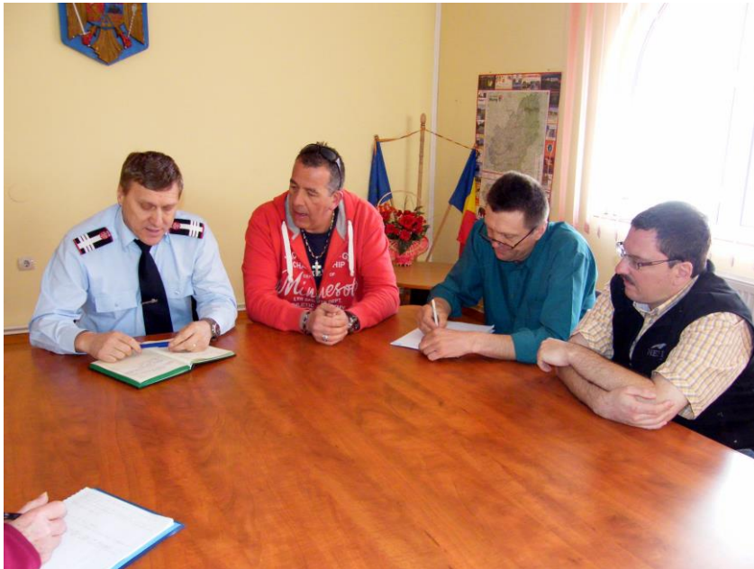
Le comité de pilotage en séance avec l'ISU à Deda

Depuis 2010, il est membre du Comité de pilotage du projet « 4 centres incendie pour 4 régions de Roumanie » et s'est particulièrement occupé de la dotation en matériel des centres régionaux créés.