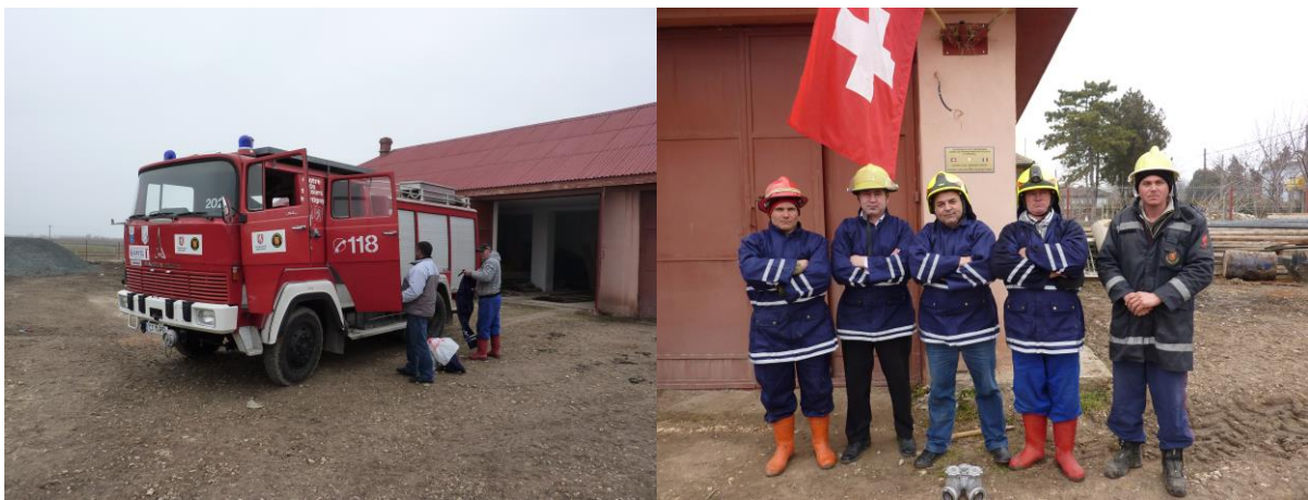
Camion remis en 2009

En 2012, des équipements personnels ont été remis aux pompiers d'Oltina.