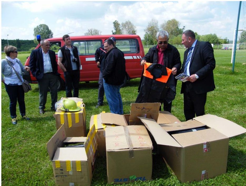
Remise de matériel au SVSU de Bonțida

En juin 2017, un petit véhicule a été remis au maire de Gherla pour renforcer la dotation du SVSU Gherla.