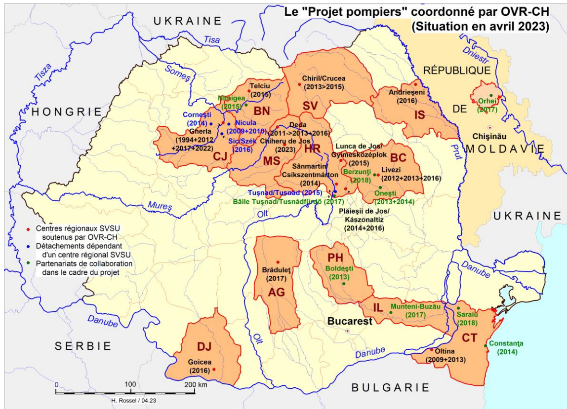
Carte : Hubert Rossel