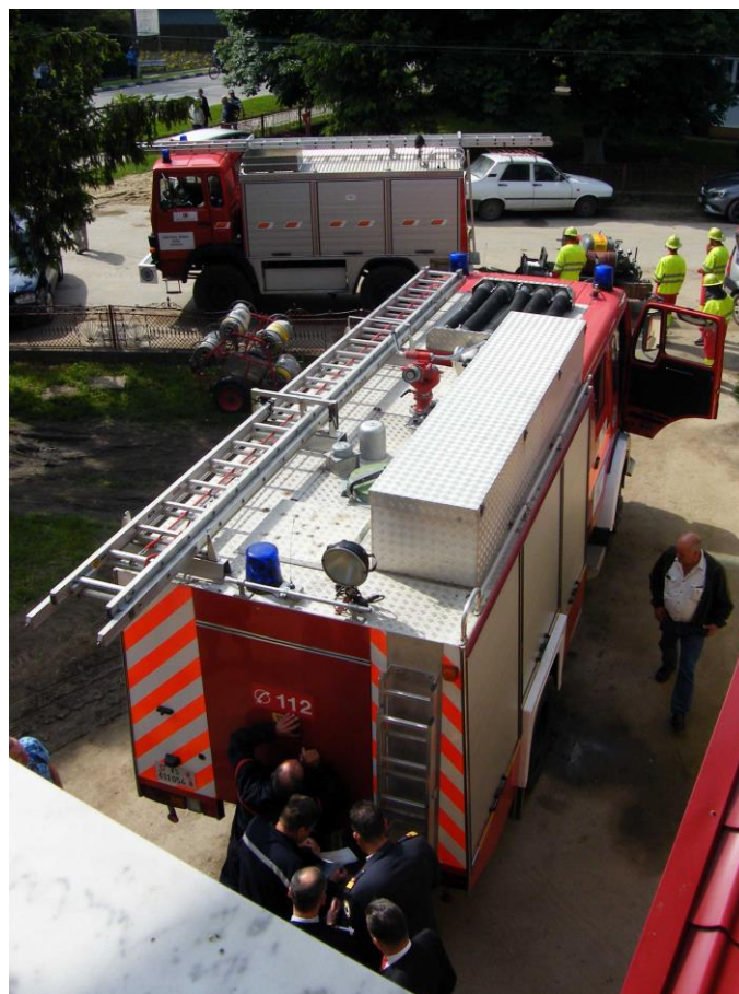
Les 2 camions remis à la commune de Goicea