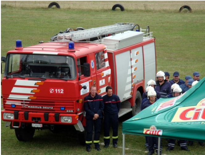
Le véhicule remis au SVSU

C'est en fanfare que s'est déroulée, en septembre 2015, la cérémonie de remise d'un véhicule d'intervention, dans le cadre de la fête marquant les 25 ans du partenariat Marly-Tușnad.