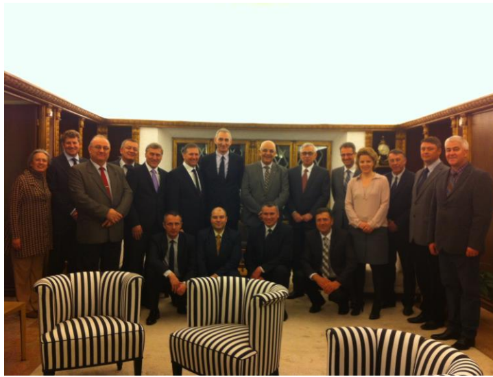
A la Résidence de l'ambassade de Suisse

Durant 4 jours, un riche programme d'échanges et de visites a été proposé et durant chaque visite des thématiques différentes ont été abordées. Ce séjour a également donné la possibilité de rencontrer les pompiers partenaires de plusieurs centres SVSU de notre projet.