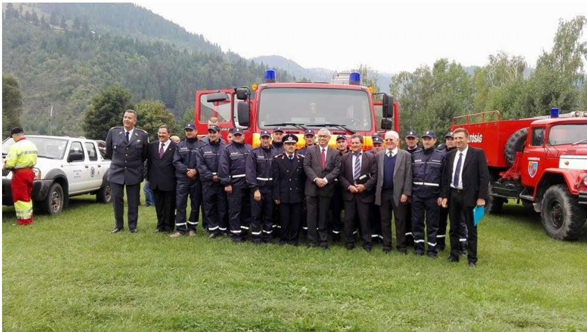
Les pompiers volontaires et les représentants des partenariats devant le camion de Lunca de Jos/Gyimesközéplok