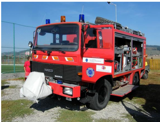
Camion remis à la mairie

Ce véhicule complète la dotation existante des pompiers de Sânmartin/Csíkszentmárton qui possédaient déjà un camion tonne-pompe.