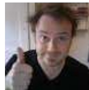
Jean Samuel Racine